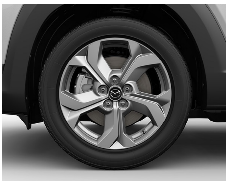
JANTE DE ALIAJ 18 ARGINTIU METALIC