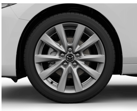
JANTE ALIAJ 18 CU PNEURI 215/45 R18