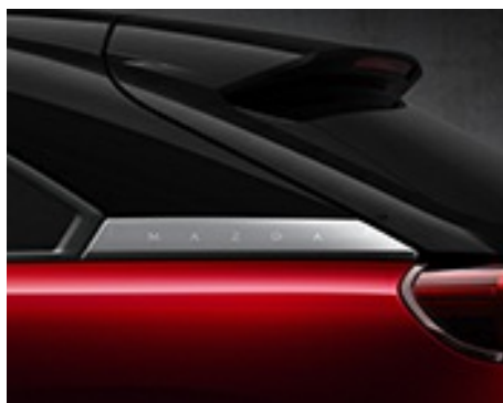
ROȘU SOUL CRYSTAL 3-TONURI