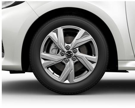
JANTE ALIAJ 16 CU PNEURI 195/55 R16