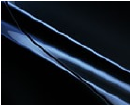
ALBASTRU DEEP CRYSTAL