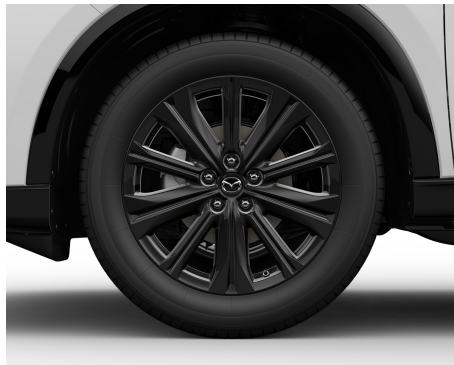
JANTE ALIAJ 19" NEGRE – 225/55 R19