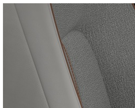
MODERN CONFIDENCE, TAPIȚERIE PIELE SINTETICĂ ALBĂ CU TEXTIL GRI