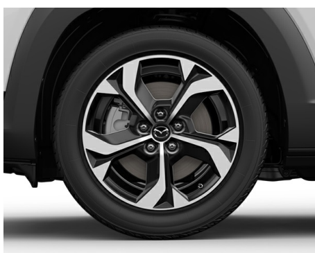
JANTE DE ALIAJ 18 NEGRU METALIC & DIAMOND CUT