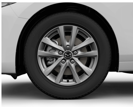
JANTE ALIAJ 16 CU PNEURI 205/60 R16