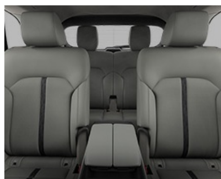
TAPIȚERIE PIELE ALBĂ, SCAUNE FAȚĂ ÎNCĂLZITE ȘI VENTILATE, SCAUNE INDIVIDUALE PRIMUL RÂND SPATE ÎNCĂLZITE