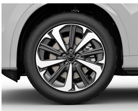
270 TRS 235/50R20 104W JANTE DIN ALUMINIU CULOARE: GREY METALLIC (7G1) + DIAMOND CUT