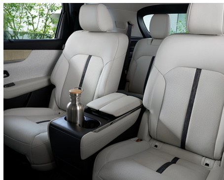
SCAUNE INDIVIDUALE (CAPTAIN SEATS) TAKUMI