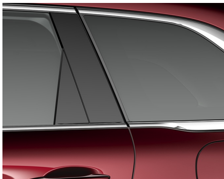
CONVENIENCE & SOUND