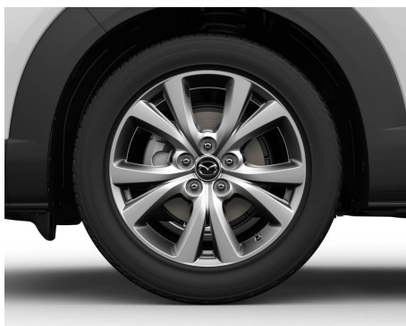
JANTE ALIAJ 18 CU PNEURI 215/55 R18