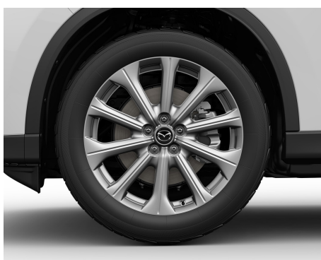
JANTE DIN ALIAJ DE 20 , ARGINTII (235 / 50 R20)